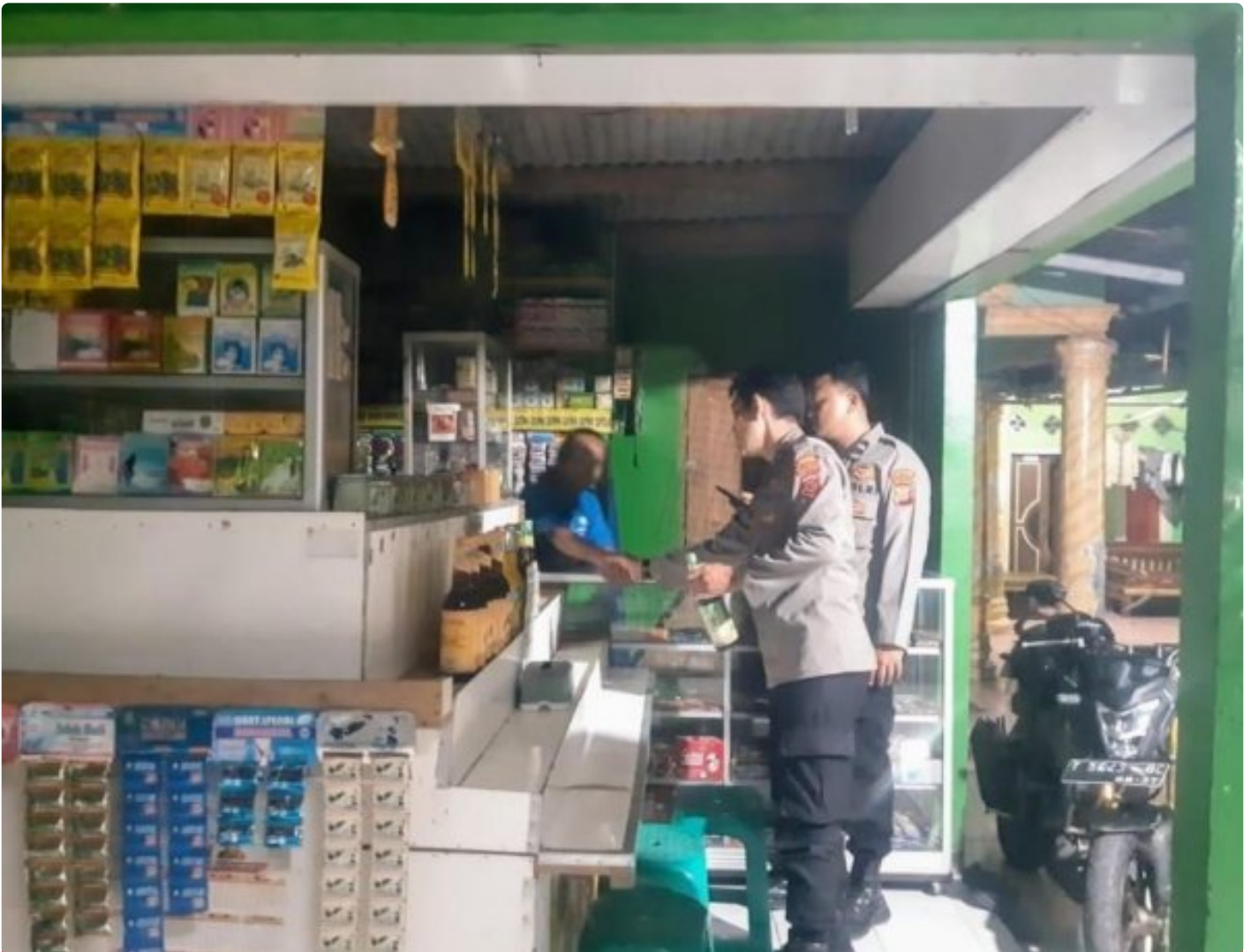
Anggota Polsek Tirtajaya Gencar melaksanakan Razia Miras Oplosan diwilayah Hukum Polsek Tirtajaya

Polres Karawang Polda Jabar, - Polsek Tirtajaya Polres Karawang Polda Jabar, untuk meminimalisir dan menekan peredaran Minuman Keras (Miras) terutama